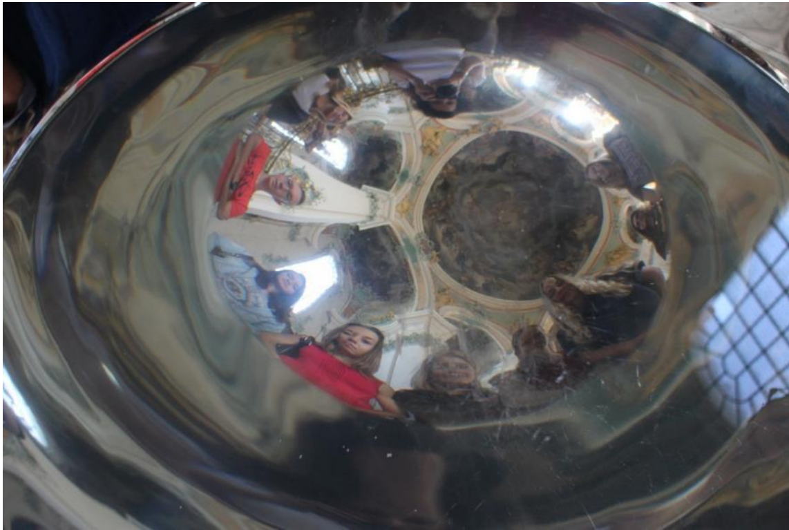
Führung durch die Kathedrale, mit Gallus- und Otmarskrypta