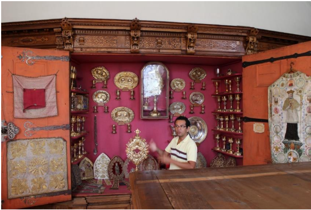
Domschatz und Dachstuhl