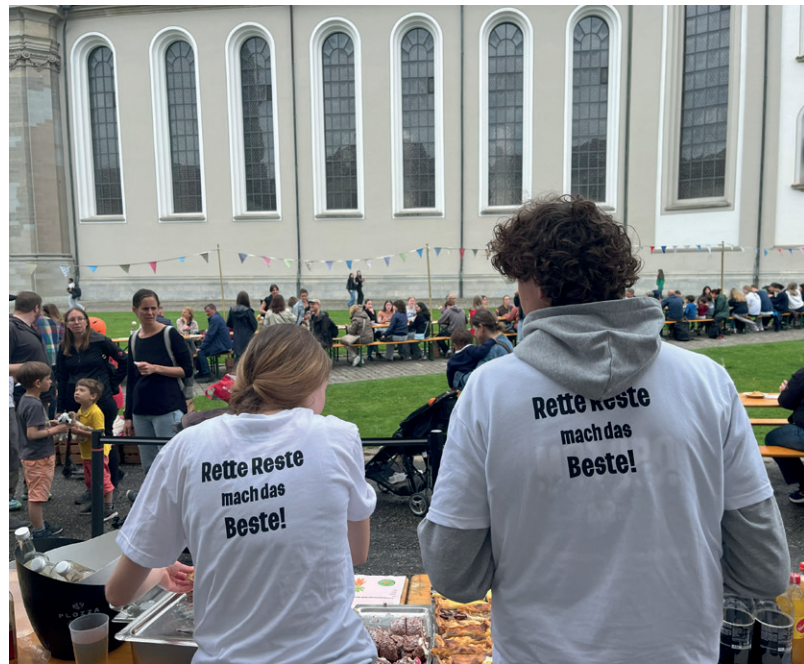
Das Foodsave-Bankett auf dem Klosterplatz ist ein Erfolg.