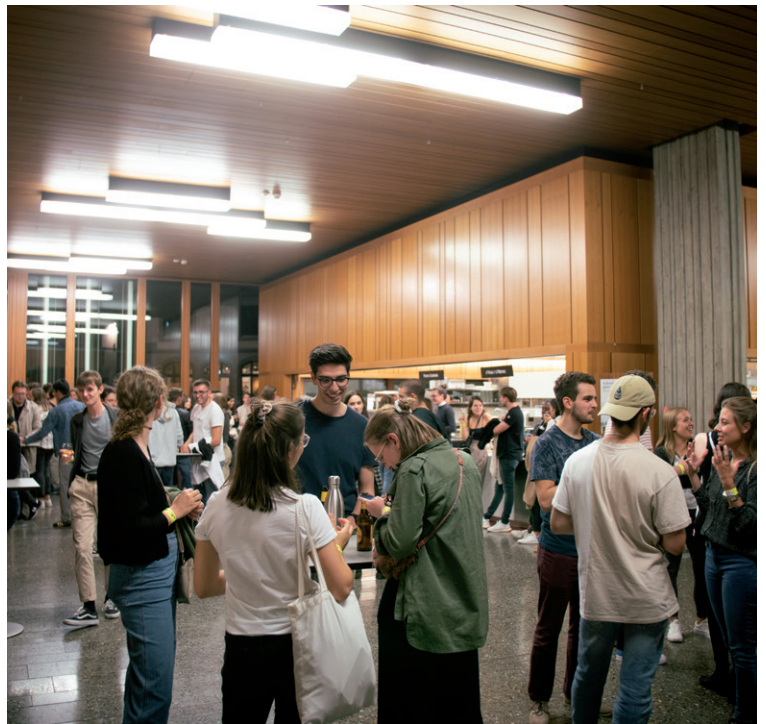
Im gut gefüllten Foyer vor der Mensa herrscht gute Laune.

Wer? | Seid ihr Ehemalige? Habt ihr vor weniger als fünf Jahren abgeschlossen? Freundschaften haben das Recht, auch nach der Schule zu bestehen. Nächstes Jahr feiert alte Zeiten und schafft neue Erinnerungen!