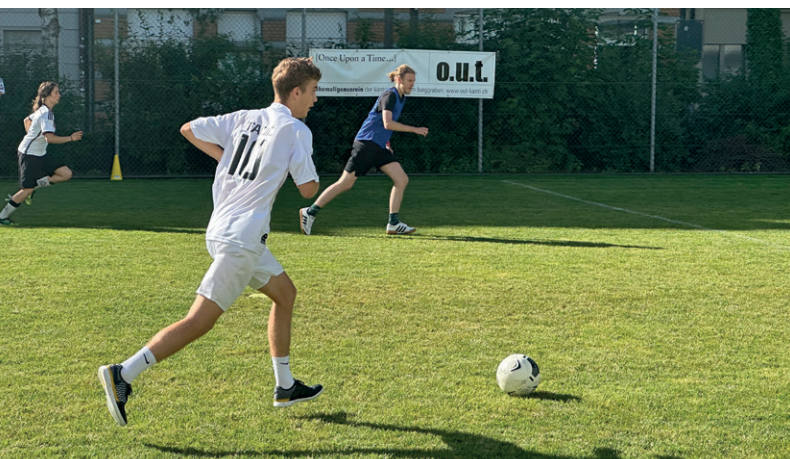
Fairplay war Trumpf.

Auf dem gesamten Schulgelände wurde zeitgleich gespielt – und das auf hohem Niveau. Die Matches in Basketball, Volleyball und Fussball waren spannend bis zur letzten Minute. Besonders beeindruckend: der grosse Einsatz und Ehrgeiz aller Beteiligten – stets begleitet von Respekt und gelebtem Fairplay.