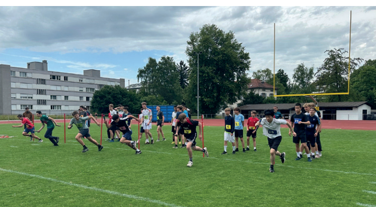
Letzter Einsatz bei der Stafette.

Im anschliessenden Teamwettkampf war vor allem Zusammenarbeit gefragt. In einer polysportiven Stafette mussten