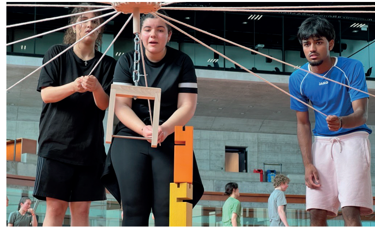
Teamwork und Geschicklichkeit waren gefordert.

Auch das Athletikzentrum war gut besucht. Hier bewältigten die Schülerinnen und Schüler in Kleingruppen einen abwechslungsreichen Postenlauf. Die Stationen forderten nicht nur Geschick und Ausdauer, sondern auch Zusammenarbeit – und sorgten für jede Menge Spass.