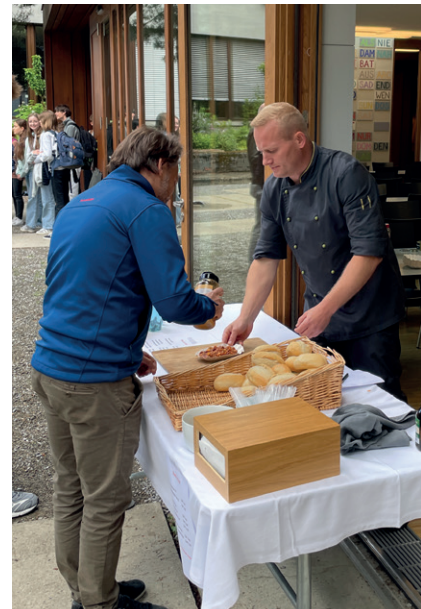
Currywurst und «Chili sin carne.»

Besucherinnen voll auf ihre Kosten. Ein besonderer Dank gilt dem ehemaligen Verein o.u.t., der traditionell den ersten 100 Besucherinnen Und Besuchern sowie allen Musikerierenden eine Wurst – seit letztem Jahr auch «Chili Sin Carne» – und ein Getränk spendiert – eine Geste, die wir sehr schätzen. Das Publikum feierte die Auftritte der einzelnen Bands mit viel Applaus und Begeisterung. Gerade für die Gruppen aus den ersten Klassen bietet «Rock im Hof» eine wertvolle Gelegenheit, erste Erfahrungen auf der Bühne zu sammeln – und ein gelungener Auftritt wirkt oft als Ansporn für weitere musikalische Projekte. Gegen Ende der Veranstaltung sorgte ein kurzer Regenschauer leider für eine Unterbrechung, weshalb bei den letzten drei Bands nicht mehr ganz so viele Zuhörerinnen und Zuhörer vor Ort waren. Ein herzliches Dankeschön geht an Vinyl, Légère, ReFlex, L8 Nights, Exoh, Stellar, Metro und Offline, ihr habt mit euren Shows das Publikum begeistert! «Rock im Hof» ist längst mehr als nur ein Konzert: Es ist ein Ort der Begegnung, des Austauschs und des gemeinsamen Feierns. Wir freuen uns schon jetzt auf die nächste Ausgabe im Jahr 2026!