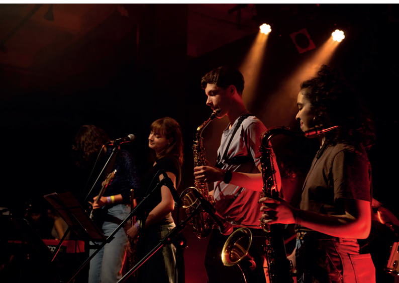
Kantibands sammeln Bühnenerfahrung am «Kanti x flon»..

prägt. Sie werden ihr Amt an dieser HV abgeben. Ab nächstem Jahr wird sich ein neues Team darum kümmern, dass die Reunion auch zukünftig ein freudiges Wiedersehen bleibt.