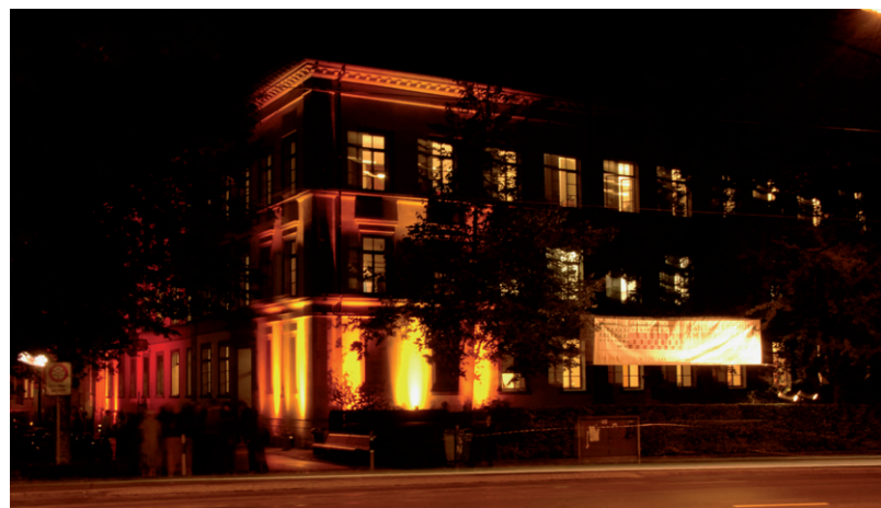
Kanti by Night.

Studieninfo | 2025 fand die Studieninfo zum fünften Mal statt. In Zusammenarbeit mit der Schulleitung, den aktuellen Maturandinnen und Maturanden sowie Ehemaligen der letzten fünf Abschlussjahre wird ein unkomplizierter Austausch organisiert rund um Fragen: Wie schwierig ist das erste Jahr des Medizinstudiums? Oder wie finde ich einen günstigen WG-Platz? Rund 30 Ehemalige nahmen sich Zeit, um Fragen der interessierten Viertklässlerinnen und -klässler zu beantworten. Die Teilnehmenden schätzen den Austausch mit aktuellen